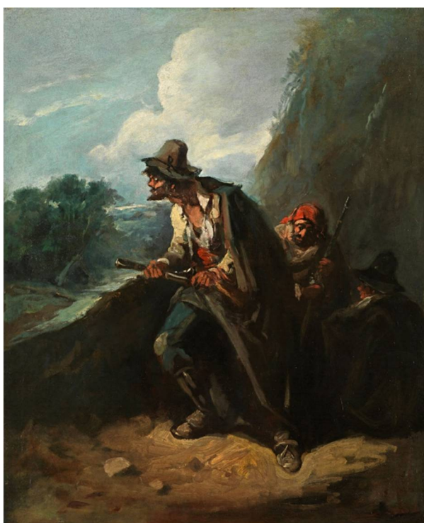
Figura 3. Óleo de Eugenio Lucas Velázquez titulado Bandoleros (hacia 1860), depositado en el Museo Nacional del Prado (Madrid).

Contribuye de manera decisiva a la génesis del bandidaje y el bandolerismo en estos contextos preindustriales una gran ruralidad, las malas infraestructuras, la baja demografía y la consiguiente falta endémica de núcleos importantes de población. También el predominio de un sistema de explotación agropecuario basado en el señorío y el latifundio, que induce la presencia de una masa poblacional flotante -y migrante- de jornaleros y empleados poco cualificados. Tiene gran importancia, a su vez, una orografía accidentada y agreste en la que las vías de comunicación son escasas y deficientes, lo cual facilita la acción sorpresiva, la huida y la posterior ocultación. Por último, no es menos importante la presencia de rutas comerciales importantes, pero mal vigiladas, controladas y/o reguladas a causa de un escaso -a menudo disfuncional por diversos motivos sociopolíticos- control administrativo, judicial, tecnológico y “policia” del territorio. Condiciones que, en general, fueron la norma en todos los espacios peninsulares -no solo en Andalucía, aunque haya sido el bandolero 1 andaluz el más popular y difundido- desde