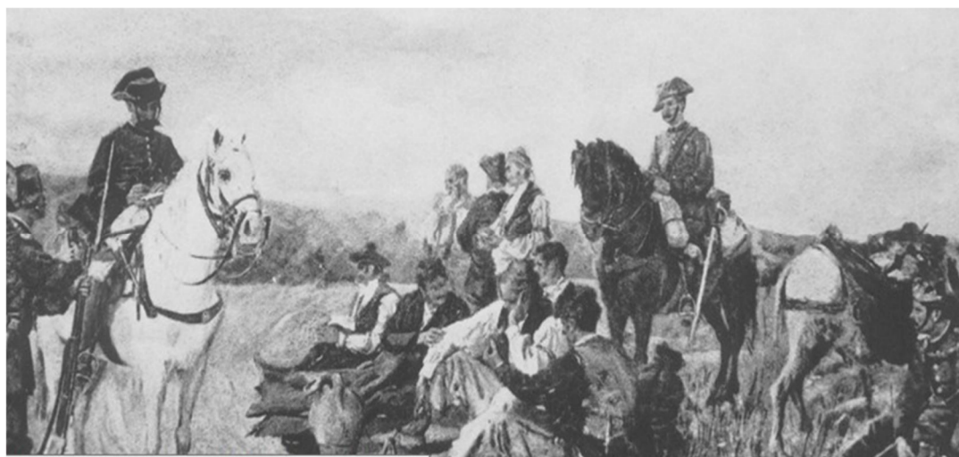
Figura 10. Detalle de la obra Cambio de parejas de la Guardia Civil (1874) de Luis Franco y Salinas, donde se recrea los papeles de la Guardia Civil en la conducción de presos y en las identificaciones en los caminos en los primeros años de su fundación (Museo del Prado).

Hay un grave error de fondo, por tanto, en la idea de que la sociedad legítima y honrada tiende a rechazar de forma “natural” el mensaje del delito cuando este, bien porque resulte atractivo, divertido o bien porque parezca simplemente entretenido, logra impregnar las prácticas socioculturales y artísticas. La identidad genuina de la narcocultura no reside únicamente en las clases bajas que “viven” en ella, sino también en la apropiación de sus discursos que realizan las élites culturales, económicas, periodísticas y artísticas al convertirla en objeto apropiado para la creación y/o reflexión. Frente al viejo modelo supervivencial del bandolerismo, el narco vende paraísos: es búsqueda de placer inmediato, riqueza y prosperidad rápidas, riesgo aventurero y también, por qué no decirlo, cierta expresión de posmodernidad (Correa Ortiz, 2022).