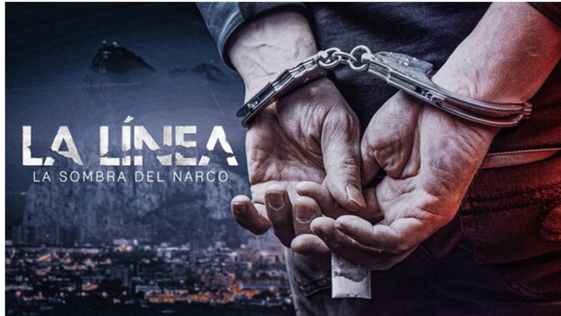
Figura 8. Promocional de la miniserie documental La Línea. La sombra del narco , dirigida por Pepe Mora y distribuida por Netflix (2020).