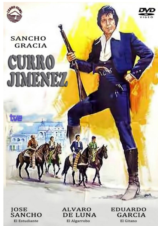
Figura 4. Cartel promocional de la serie de RTVE Curro Jiménez (1976-1979).

Lo mismo puede decirse de infinidad de bandoleros de la España decimonónica que, por este camino de la catarsis colectiva aderezada de romanticismo, protagonizaron perspectivas públicas del fenómeno criminal que colocaron inevitablemente a los