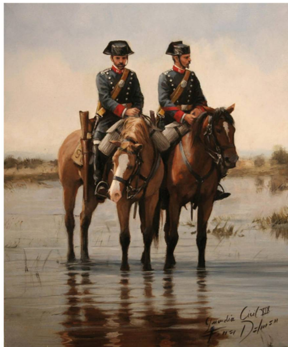
Figura 7. Pareja de la Guardia Civil a caballo en el siglo XIX, obra de Augusto Ferrer-Dalmau.

Si lo que se pretende es entender esta necesaria estrategia comunicativa, siempre cabe preguntarse qué alimentaba los mitos en torno al bandolero-bandido-malhechor. No cabe contentarse con los muy difundidos folklorismos de Conancio Bernaldo de Quirós (1873-1959), quien equiparaba, en un panegírico del panorama cultural nacional que bien haría las delicias de turistas, amigos de lo kitsch y partidarios del determinismo étnico, a bandoleros -concretamente los andaluces- con majos y toreros (Bernaldo de Quirós, 1912; García Benítez, 2008). Muy probablemente estos argumentos tendrían pleno sentido para la reflexión historiográfica de comienzos del siglo XX, pero son inaceptables, por tópicos y sesgados, desde una perspectiva presente, ajena en la medida de lo posible a veleidades psicologicistas , a la par que tendente al análisis formal de hechos y datos concretos. Y es que la manifestación palmaria del bandolerismo decimonónico, el que encuentra un coyuntural auge en Andalucía a la par que va declinando en el resto de la Península Ibérica, haya su razón de ser en un panorama marcado por el latifundismo, el caciquismo, la proliferación de una casta de proletariado agrícola desposeída, una peculiar orografía e