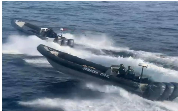
Figura 11. Imagen de archivo de una persecución realizada por agentes del Servicio Marítimo de la Comandancia de Algeciras.

el que el problema se desenvuelve, estarán condenadas al fracaso, pues sólo afectarán a uno de los flancos de la cuestión. Bien estaría que lo comprendieran las diferentes administraciones públicas, perdidas habitualmente en confrontaciones políticas innecesarias e intereses partidistas espurios que no llevan a parte alguna, así como los actores del sector privado, cuyo concurso a estas alturas es ya irrenunciable para el desarrollo y mejora de los contextos socioculturales en los que opera.