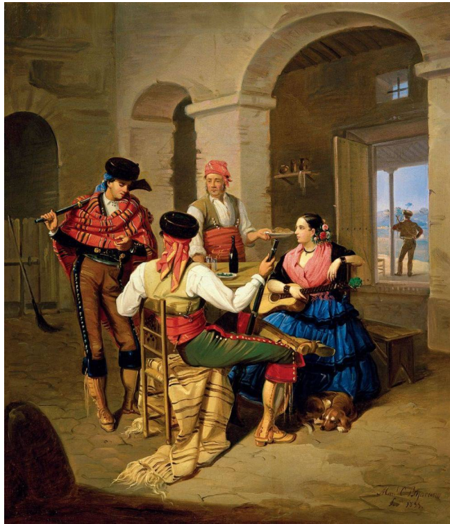
Figura 1. Escena de una venta (1855), óleo de Manuel Cabral y Aguado Bejarano (Museo Carmen Thyssen, Málaga).

La cuestión, aceptando que estas consideraciones idealizadas sobre determinadas actividades delincuenciales pudieran ser ciertas desde un enfoque antropológico, e incluso historiográfico, claro está, reside en preguntarse qué lugar destina tal perspectiva a la acción del agente de la ley. Porque, cuando se asumen acríticamente los planteamientos históricos que analizan la actividad humana como un simple relato lineal de “buenos” y “malos”, tal lógica confrontativa suscita de inmediato tesis extravagantes. Por ejemplo: si el bandido es “el bueno”, entonces quien lo persigue, en tanto que agente del poder opresor que trata de aplastar a la plebe inerme de la que emerge, no puede ser otra cosa que “el malo”. Ello torna el problema en un asunto laberíntico y deformante que, irónicamente, transforma al defensor de esa ley -en el fondo “hecha para los ricos”- en un puntal que sostendría inadvertidamente el “lado malo” de la historia. Así, no es que el/la agente de la ley sea una “mala persona”, sino que se pondría inadvertidamente, en el cumplimiento de su función, a disposición de una institucionalidad malvada. Planteamientos que, como es de suponer, no solo debieran matizarse, sino que, incluso desde fuera de los ámbitos relacionados con la investigación científica estandarizada, encuentra ocasionalmente cuestionamientos a contracorriente más que razonables: