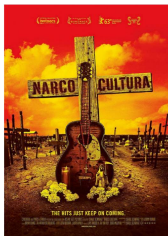
Figura 9. Carátula del largometraje documental norteamericano Narco Cultura , sobre la explosiva cultura narco mexicana, dirigido por Shaul Schwarz en 2012.

Todos estos eventos son bien conocidos con relación a las narcoculturas colombiana o mexicana (cárteles, maras, etcétera), en las que estos problemas son endémicos y por ello han sido profusamente estudiados (Figura 9) (Correa Ortiz, 2022). Por el contrario, se trata de cuestiones escasamente observables -o consideradas “puntuales”- en el contexto español, en el que, por tratarse de cuestiones aisladas y emergentes, no dejan de producir cierta perplejidad entre unos analistas que conocen muy bien los eventos sociológicos y criminogénicos del así llamado Primer Mundo , pero parecen tener más dificultades a la hora de calibrar el peso de los eventos antropológicos y culturales sobre esta clase de fenómenos. Así se explica, posiblemente, que la actitud minoritaria de los jóvenes que grabaron y jalearon la embestida contra la embarcación de la Guardia Civil, pese a ser un evento aparentemente anecdótico, colateral al suceso mismo, resultara cosa especialmente noticiable para los medios de comunicación. Consecuencia: el bandolerismo y la narcocultura beben en sus orígenes, quizá, de las mismas fuentes y por ello se asemejan en sus formas de justificarse, pero ni se valen de los mismos mecanismos, ni propenden los mismos objetivos, ni tienen la misma potencia y alcance. En un contexto global, pues, parece tener cada vez menos sentido caer en la tentación de realizar análisis locales.