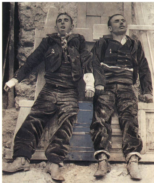
Figura 2. Fotografía de autoría anónima en la que se exhiben los cadáveres del célebre bandolero Francisco Ríos González, “El Pernales”, a la derecha y marcado con el número 1, y Antonio Jiménez Rodríguez, “El Niño del Arahál”. La imagen fue encargada por la Guardia Civil después de que ambos fueran abatidos a tiros en Villaverde de Guadalimar (Albacete), a fin de documentar y publicitar el final del que fuera uno de los bandoleros “más buscados” de la España de la época.