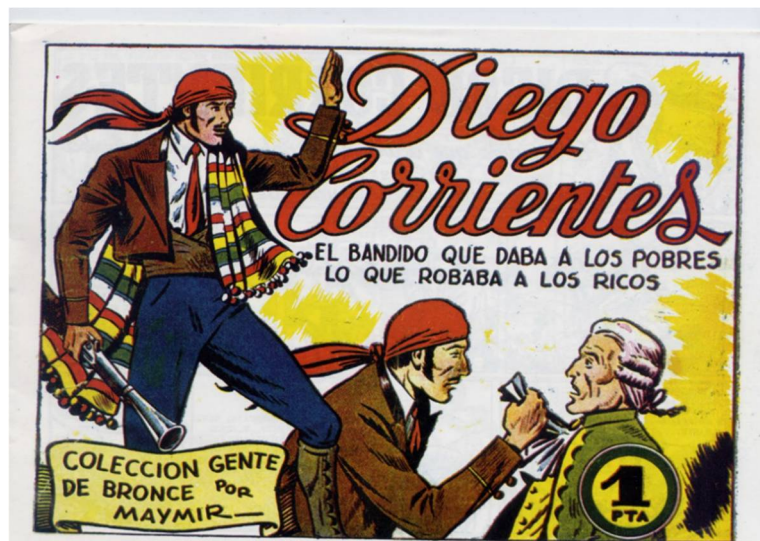
Figura 5. Portada del cómic titulado Aventuras de Diego Corrientes , se la serie Gente de Bronce (Ameller Editor, Barcelona, 1950).

Así las cosas, tiene lógica que, con el paso de los años, la Guardia Civil nunca empleara la estrategia de comunicación de servirse de la publicidad acerca de las mismas leyendas sobre los “bandidos del pueblo” que se propagaban entre la población, para justificar sus propios éxitos. Posiblemente, se hubiera provocado un indeseado efecto de rechazo entre buena parte de la población, pues, aceptar tal retórica, ineludiblemente, habría significado colocarse de manera indeseada en el lado negativo de la historia. Por ello, conceptos como “bandolero” o “bandolerismo” nunca fueron de uso común por parte de la Benemérita durante décadas, siendo la de “malhechor” la denominación habitual de aquellos a quienes se perseguía (Núñez, 2017). Un hecho que tuvo un importante efecto psicosocial al llevar a parte del espectro poblacional, especialmente las clases emergentes, a la siempre saludable duda. Pero que, retroactivamente, también pudo contribuir al alimento del mito romántico por parte de los partidarios más consolidados del -así